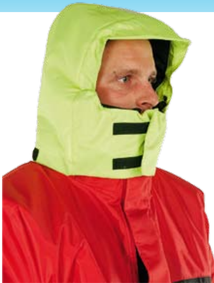
Schützt den Kopf: eine Kapuze mit Schirm

Wir wünschen allen Teilnehmern viel Glück und den Testern sichere und warme Angeltage in ihrem neuen Mullion-Anzug!