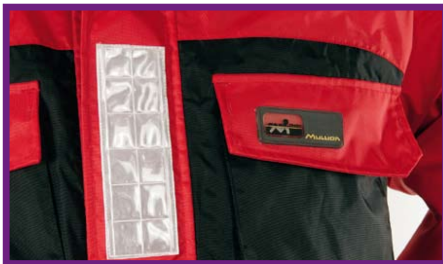
Reflektierende Streifen sorgen dafür, dass der Träger im Notfall leichter gefunden wird

Wer nicht das Glück hat, von unsere Redaktionsfee als Tester ausgelost zu werden, den 1M18A AquaFloat aber trotzdem ausprobieren möchte, bekommt ihn über den Deutschlandvertrieb Dotzel Outdoor natürlich auch im Fachhandel. Internet: www.dotzel-outdoor.de und www.mullion.be Oder aber Sie werben einen Rute&Rolle-Abonnenten. Denn im Moment bieten wir den Mullion 1M18A als Prämie mit nur 25 Euro Zuzahlung für die Vermittlung eines Zwei-Jahres-Abos an (Seite 61 in diesem Heft).